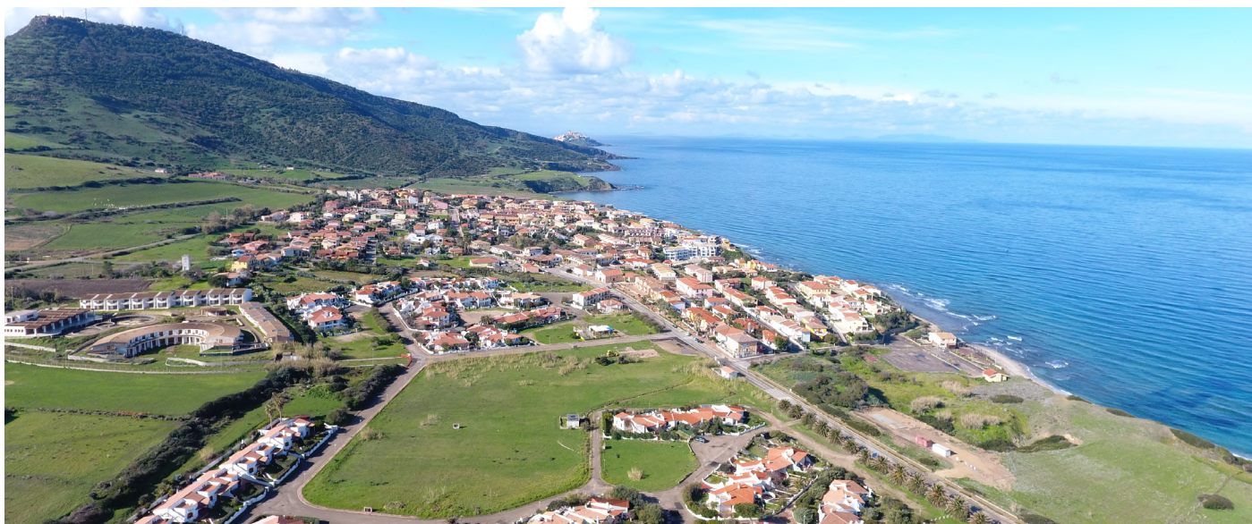
LA SPIAGGIA DI SAN PIETRO (VALLEDORIA)