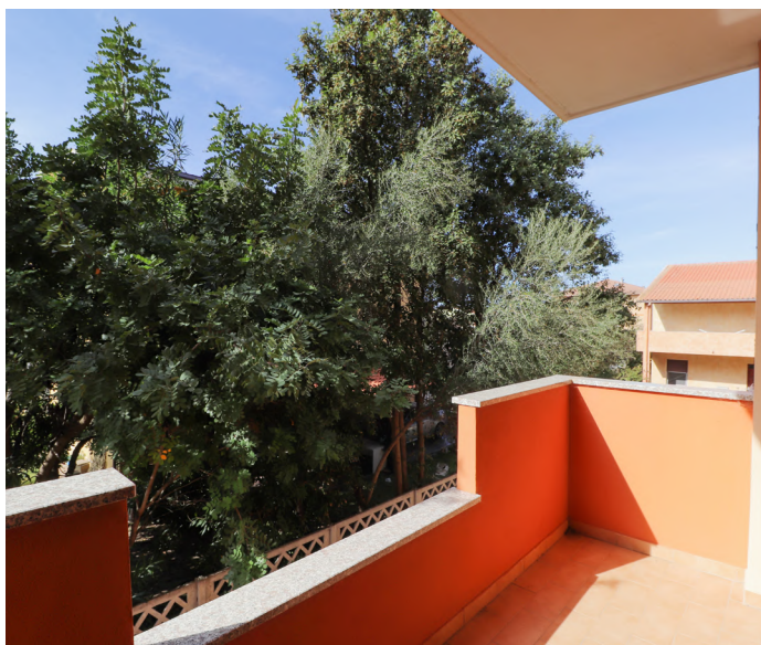
BILOCALE A VALLEDORIA - €59.000