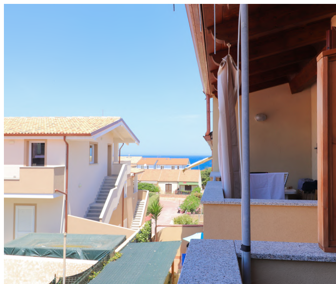
TRILOCALE A VALLEDORIA - €113.000