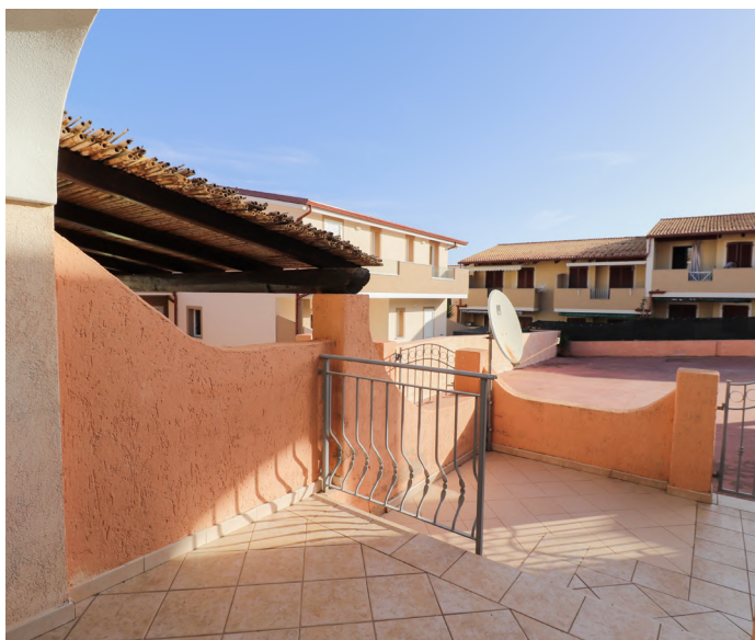
TRILOCALE A VALLEDORIA - €109.000