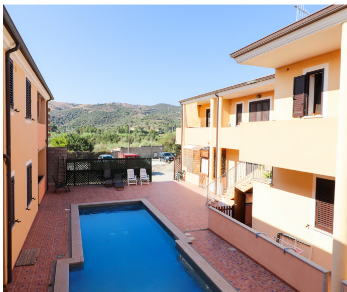
BILOCALE A VIDDALBA - €69.000