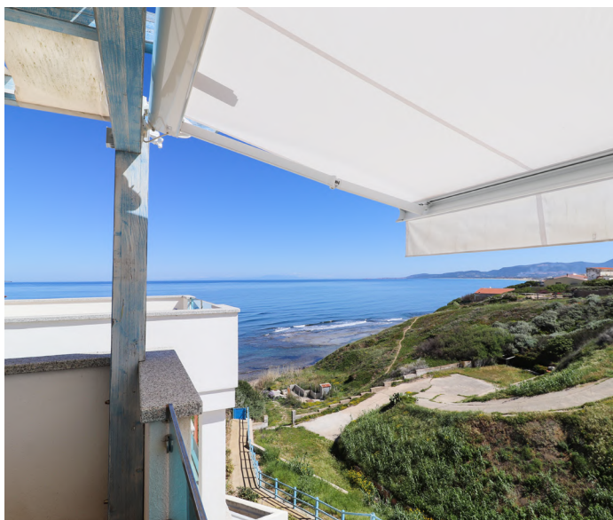
TRILOCALE A VALLEDORIA - €240.000