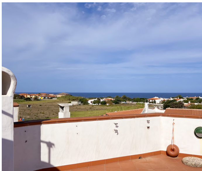
VILLA A VALLEDORIA - €249.000