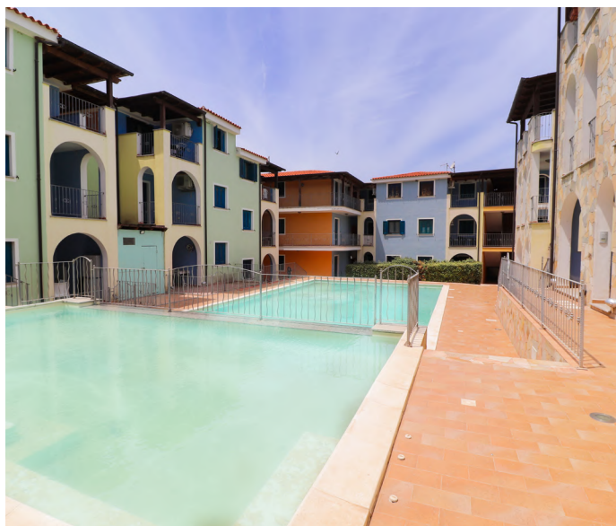
BILOCALI A VALLEDORIA - €90.000