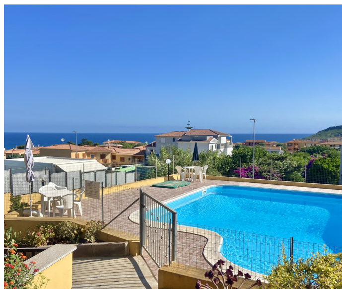
TRILOCALE A CASTELSARDO - €119.000