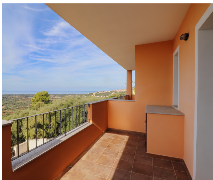
BILOCALE A BADESI - €72.000