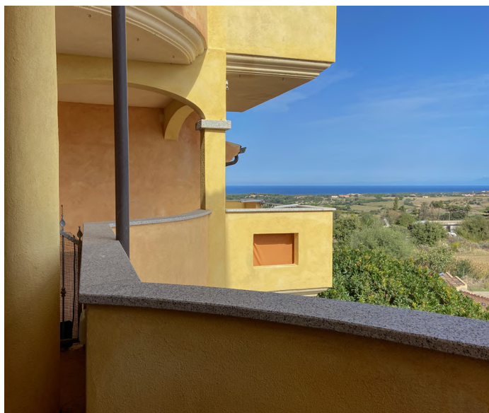
BILOCALE A VALLEDORIA - €65.000