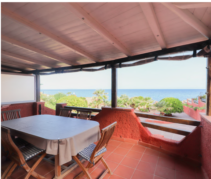
TRILOCALE A CASTELSARDO - €280.000