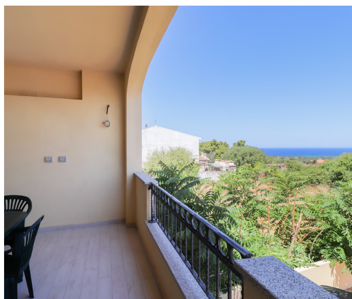
BILOCALE A VALLEDORIA - €119.000