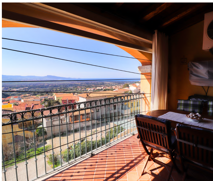
BILOCALE + TAVERNA A BADESI - €129.000