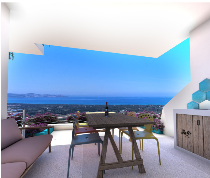
BILOCALI A BADESI - €119.000