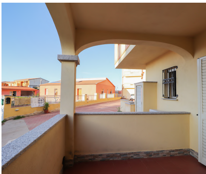
BILOCALE A VALLEDORIA - €115.000