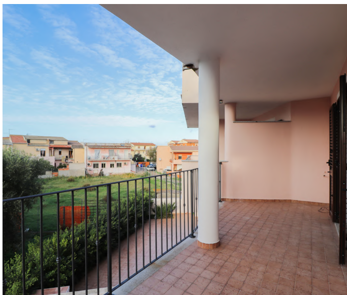
TRILOCALI A VALLEDORIA - €89.000